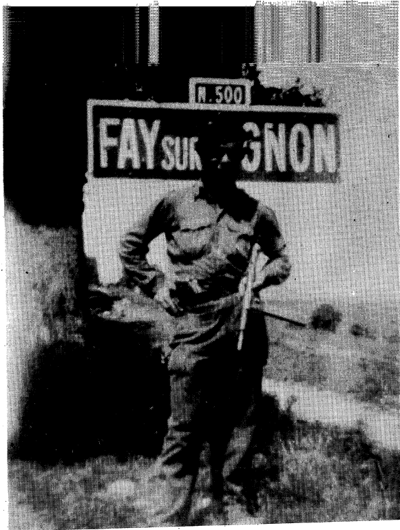
אין די ערשטע טעג פון מאַקי אין פּאַי־סיר־ליגנאַן. די הויזן זיינען נאָך דייטשע, דער באַנד אויפן אַרבל מיט דער קעפּקע, פּראַנצויזישע, דער מיטראַיעט איז אַן ענגלישער סטען, אַבער דאָס האַרץ איז אַ יידיש. גרענאַר, אַפּריל־מאַי 1944. פּראַנקרייך.